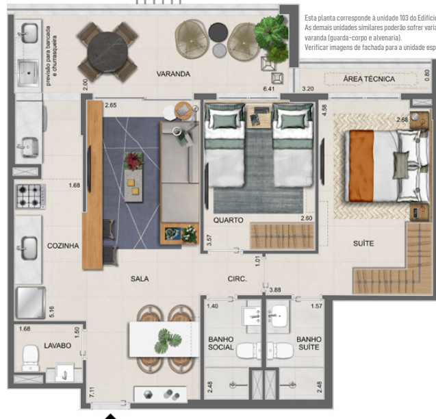
OPÇÃO SALA AMPLIADA

Elemento de fachada existente nas unidades: Ed. Âmbar: 103 e 108 203 e 208 (até a altura do guarda-corpo) Ed. Índigo: 103 e 108 203 e 208 (até a altura do guarda-corpo)