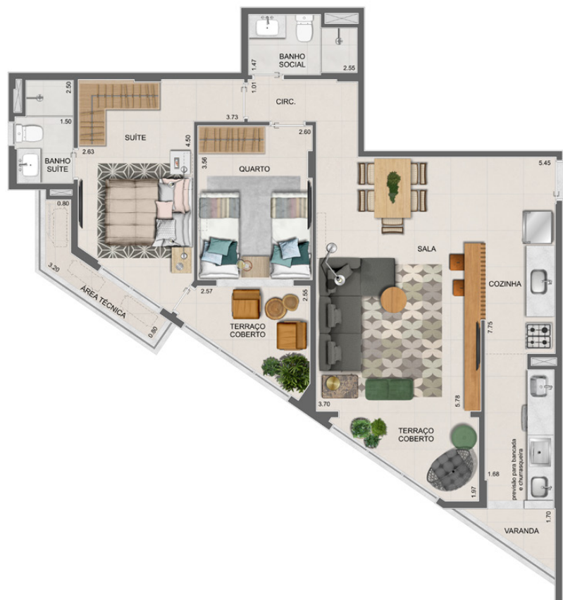
OPÇÃO COZINHA FECHADA